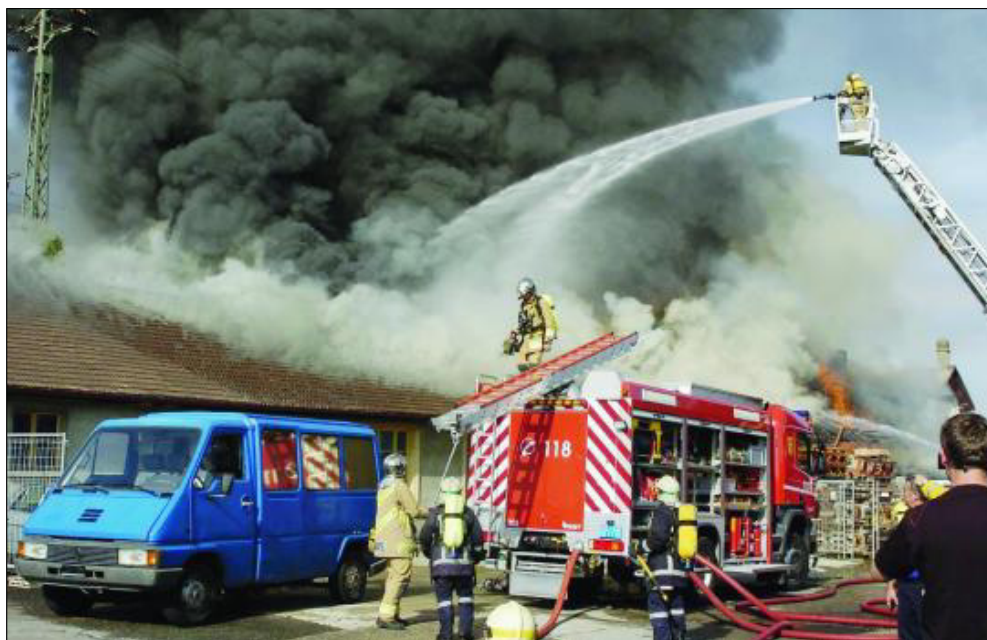
INCENDIE Vu sa violence, les pompiers ont dû aller pomper de l'eau au lac pour alimenter les six lances dont ils ont eu besoin pour parvenir à maîtriser le feu.

Il poursuit. «Les pompiers m'ont dit qu'il n'y avait pas de danger pour le moment et