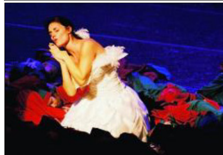
«LE SECRET DE L'ALCHIMIE» Le spectacle véhicule un message de respect ou d'amour pour les autres (SP)