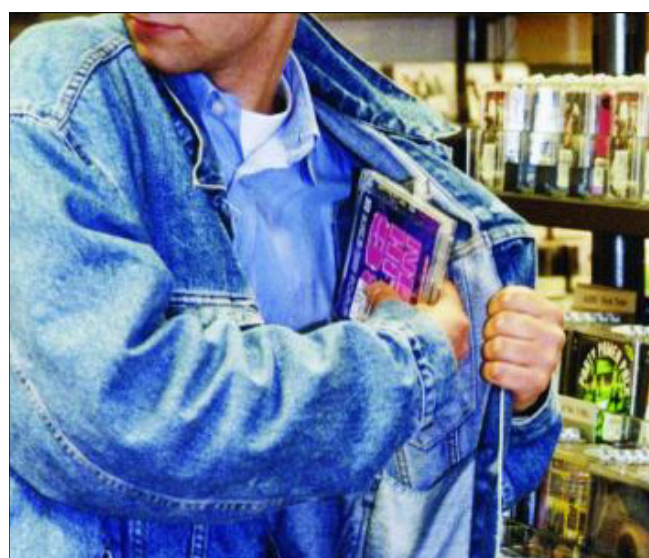
DÉLIT L'un des prévenus avait tenté un vol à l'étalage dans un magasin de la gare de Neuchâtel.

Tour à tour, chaque prévenu a eu droit à l'énumération, parfois longue, des faits qui lui étaient reprochés. Le président du tribunal, après avoir entendu les explications des parties, a raisonné les délinquants: «Ce n'est pas aux autres à faire les frais de vos problèmes». Il s'est ensuite informé des désirs